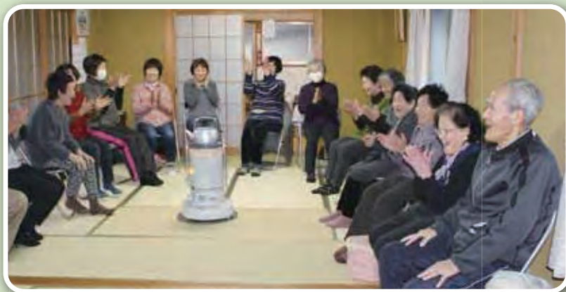
看護師の派遣（レクリエーションの様子）