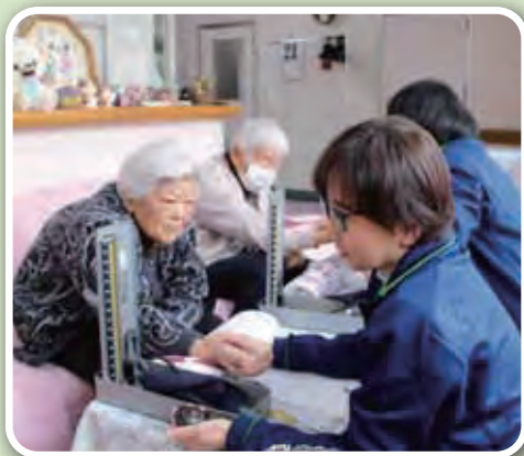
看護師による健康相談