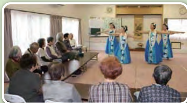
ボランティア団体の紹介