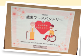
● 年末年始応援セット