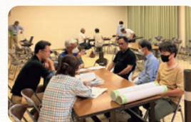
下米田支部社協 見守り会議