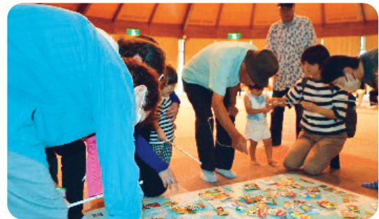
残暑祭り(令和6年8月)