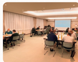
古井支部社協 ワークショップ