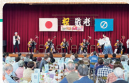
蜂屋支部社協敬老会

75歳以上の方を招待して敬老会が開催され、みなさんの笑顔が集まる機会となりました。