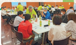
加茂野支部社協研修会