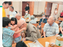
山之上支部社協敬老会