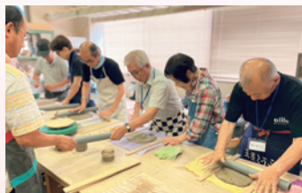
▲まちの大学minokamo(陶芸・そば講座・スマホ講座)