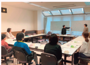
▲ボランティア活動支援