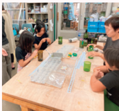
▲ひとり親家庭交流