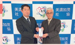
カヤバモーターサイクルサスペンション労働組合