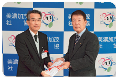
美濃加茂市健寿連合会