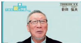
▲不登校親の学校みのかも校