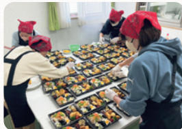
伊深支部社協お弁当作り

年に3回、ボランティア団体「あじさいの会」が作ったお弁当が福祉委員を通じて地域の高齢者に配られ、地域の高齢者と顔を合わせてお話をする機会となっています。