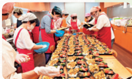
かものかども食堂