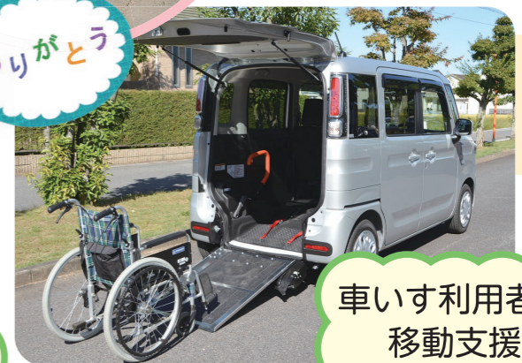
車いす利用者の 移動支援

社協では、地域のみなさまからいただいた会費や寄付金を、地域の福祉活動に大切に活用しています。