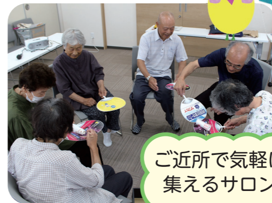
ご近所で気軽に 集えるサロン